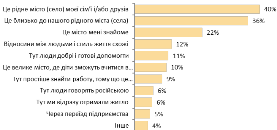
Діаграма 1.5. Причини вибору місця для переселення (Питання: Чому Ви обрали це місто та регіон для переселення? Питання з можливістю обрати декілька варіантів відповідей)