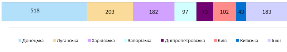
Діаграма 1.1. ВПО в Україні за регіонами (тис. осіб) 81

Значну частину ВПО складають найменш захищені категорії населення: люди пенсійного віку, діти, інваліди. Серед ВПО 13% становлять діти.